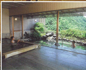
玉造温泉 佳翠苑皆美 (島根県松江市)