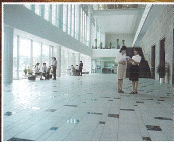
ソフトビジネスパーク島根 テクノアークしまね (島根県松江市)