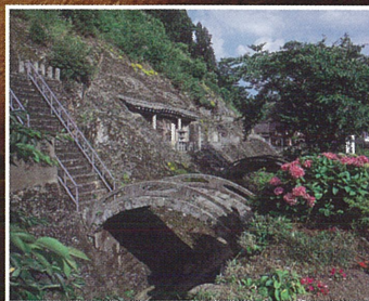
石見銀山 羅漢寺の石橋 (島根県大田市)