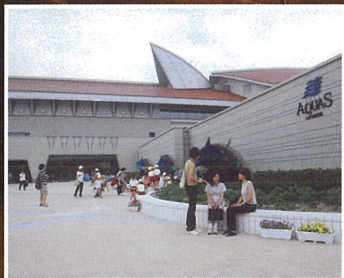
しまね海洋館アークアス (島根県浜田市)