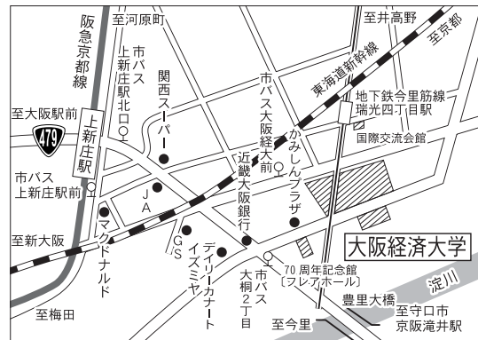
大阪試験場案内図