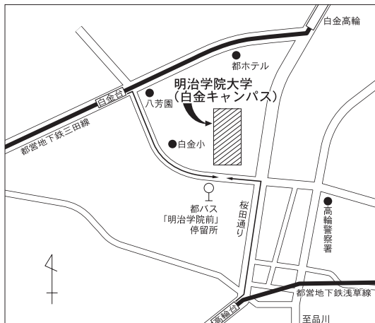
東京試験場案内図