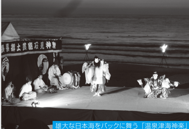
雄大な日本海をバックに舞う「温泉津海神楽」