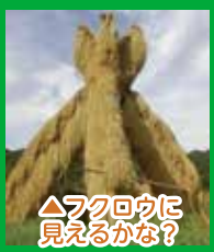
△フクロウに見えるかな？

※伝統のはで干し「ヨズクハデ」には、強風の中、はで干しに苦しむ農民を見た海神が、漁師の漁網の干し方を伝えたことが起源との説話が残されている。