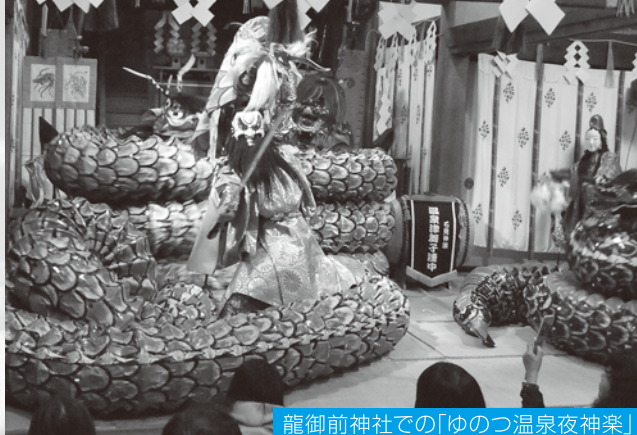
龍御前神社での「ゆのつ温泉夜神楽」