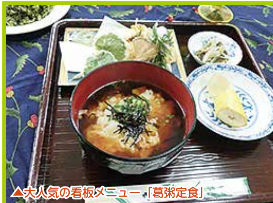
▲大人気の看板メニュー「葛粥定食」