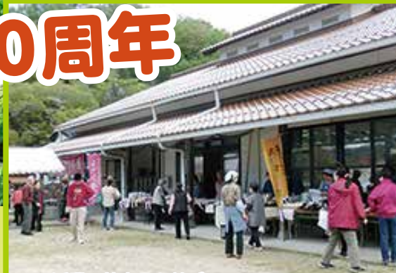
▲▼近隣の特産品も並び、多くの買物客でにぎわいました