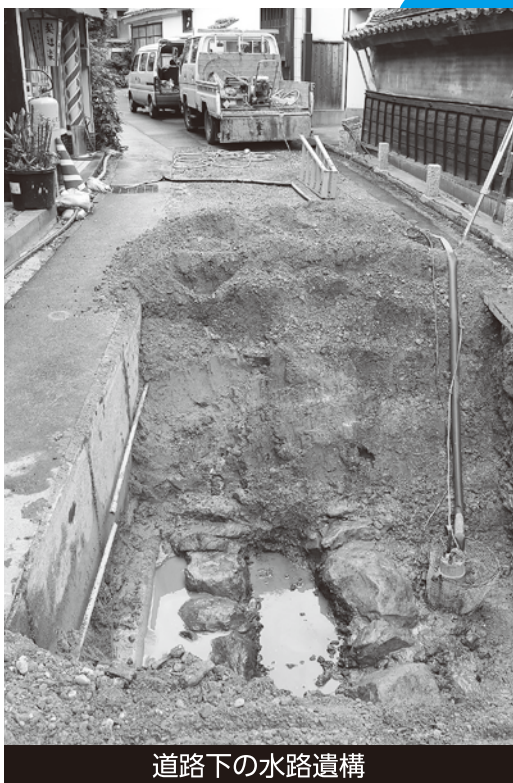
道路下の水路遺構

温泉津地区は石見銀山遺跡を構成する重要な地区の一つとして、平成19年7月に世界遺産に登録されました。大田市では平成27年度から、温泉津地区の環境整備事業に伴う発掘調査を行っています。温泉津の歴史と発掘調査に至る経緯、発掘調査から得られた成果について3回にわたって、紹介します。