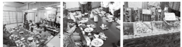
▲平和亭 ▲かめや ▲暖DAN

大田といえば海の幸。そんな海の幸を満喫しました。暖DAN(波根町)では海鮮バーベキュー、平和亭(大田町)ではへか焼き、かめや(仁摩町)では刺身定食をいただきました。都会では味わえない新鮮な海の幸の美味しさに、参加者は満足そうな様子でした。