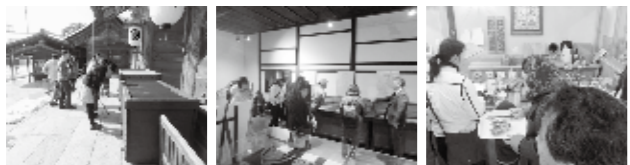
▲出雲大社参拝 ▲石見银山資料館を見学 ▲大森町歌謡館でドイツの唄へ