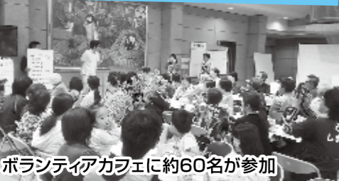
ボランティアカフェに約60名が参加

被災された皆様の1日も早い復興をお手伝いするため、4月12日に、大田市社会福祉協議会が『大田市災害ボランティアセンター』を開設されました。屋根へのブルーシート張り、瓦などの瓦礫や室内外の片付けなど様々な要望にお応えし、生活に不安をかかえておられる方々の力になるため活動されています。