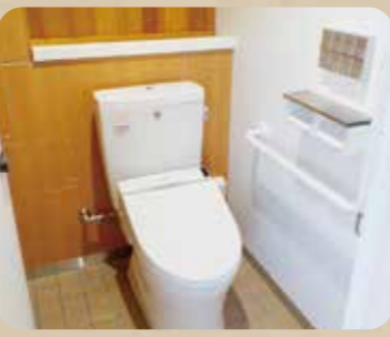
生まれ変わったトイレ

天体観測やアウトドアが楽しめる「北の原」、広大な草原が広がる「西の原」、リフトで太平山の山頂まで上がる「東の原」の三瓶山周辺3か所にある公衆トイレが、島根県の事業で洋式化されました。外国の方でも利用しやすいよう、英語で表記もされています。冬期でも利用可能ですので、安心してご利用ください。 ※北の原の公衆トイレは冬期利用できません。北の原にお越しの際は三瓶自然館サヒメル館内・または北の原キャンプ場センターラルロッジのトイレをご利用ください。