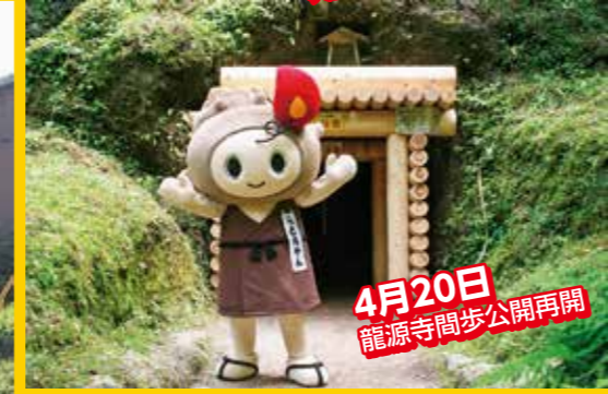
4月20日 龍源寺問歩公開再開