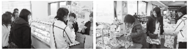
▲おみやげを買い求める