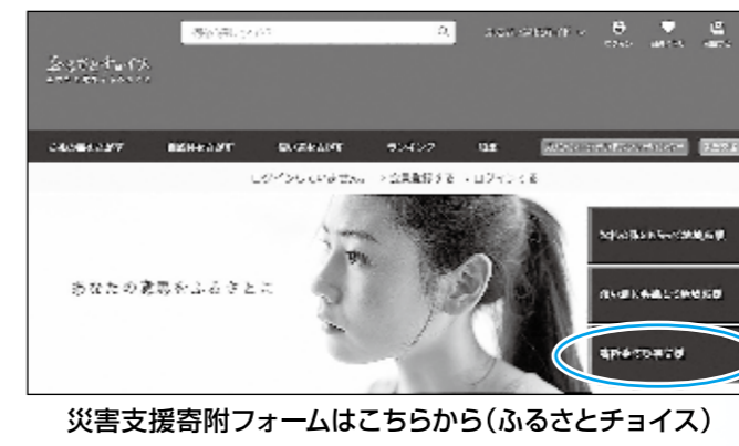
災害支援寄附フォームはこちらから(ふるさとチョイス)