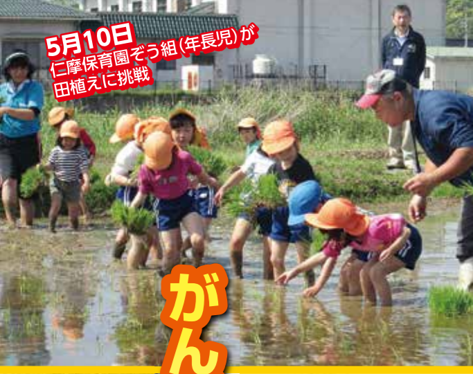
5月10日 仁摩保育園ぞう組(年長児)が 田植えに挑戦