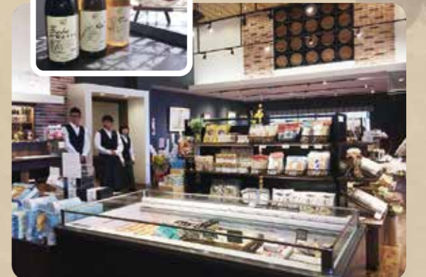
▲ワインをはじめ、魅力的な商品が並ぶ店内