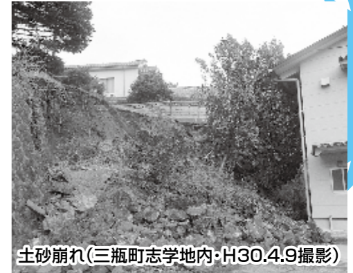
土砂崩れ(三瓶町志学地内・H30.4.9撮影)

以上が身を寄せました。家屋に被害があり、日常生活が送れない方や余震の不安から避難所へ身を寄せる方もいました。徐々に避難者の人数も減り、4月26日に全ての避難所が閉鎖されました。