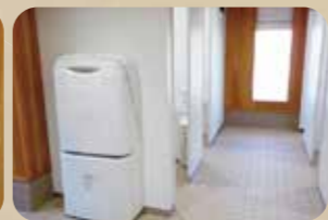
おむつ交換台も設置