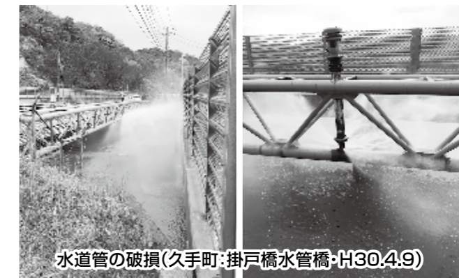
水道管の破損(久手町・掛戸橋水管橋・H30.4.9)

世界遺産「石見銀山遺跡」内の計15ヶ所で石垣や塀が崩れるなどの被害が確認されました。観光スポットの中心となる「龍源寺間歩」や限定公開ツアーを行っている「大久保間歩」に大きな被害はありませんでしたが、余震を警戒し、4月19日まで公開を休止しました。20日からは通常どおり公開しています。