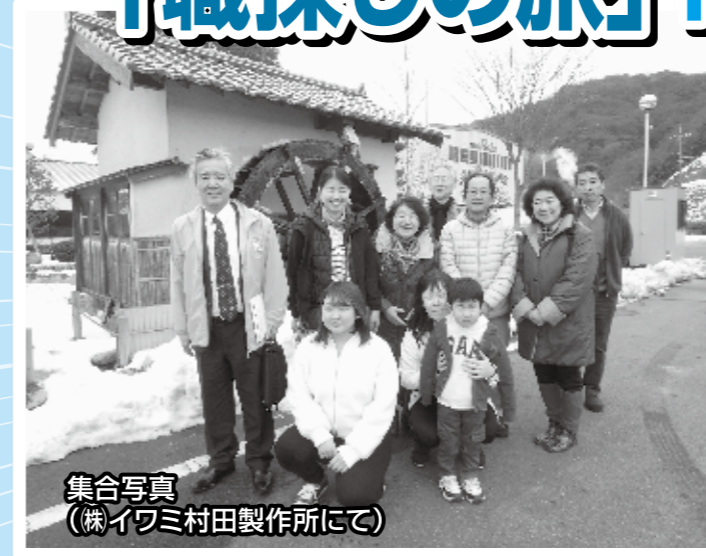
集合写真 (株イワミ村田製作所にて)

平成30年2月9日から2泊3日の日程で移住就活ツアー「職探しの旅」を開催しました。市外在住者を対象としたこのツアーには5組9名の参加がありました。移住する上で、重要な「職」にスポットを当て、工場見学や合同企業説明会、起業家訪問などを行いました。この他にも、空き家やアパートの見学、大森町の町並み散策や出雲大社参拝など、盛り沢山の内容となりました。そんな移住就活ツアーの様子をお伝えします。