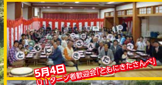
5月4日 Uターン者歓迎会「どもにきたさんべ」