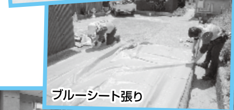
ブルーシート張り