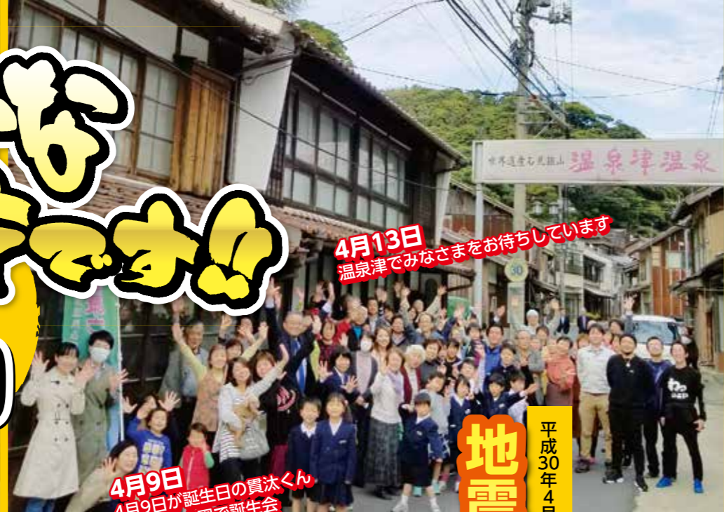
4月13日 温泉津でみなさまをお待ちしています