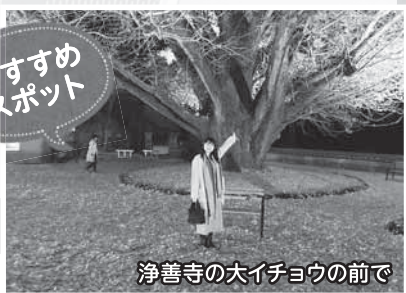
浄善寺の大イチヨウの前で