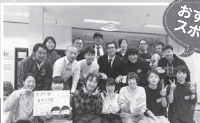
鍋を囲むイベントで世代を超えた交流