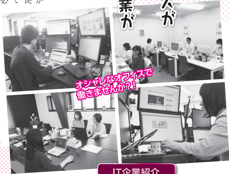
オシャレなオフィスで働きませんか?!

特に、大田市では、これまでの製造業に加え、若い人を中心に関心が高まっているIT関連企業の誘致に、積極的に取り組んでいます。IT企業は、インターネットの環境が整っていれば、地理的条件の制約が少ないため、東京で行っている仕事も地方で同じように行うことができます。また、テレワークによる自宅での就業等、働き方の多様化にもつながることが期待されます。