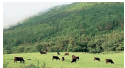
西の原で見られる放牧牛の風景