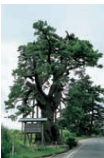
西の原にある樹齢400年の『定め松』