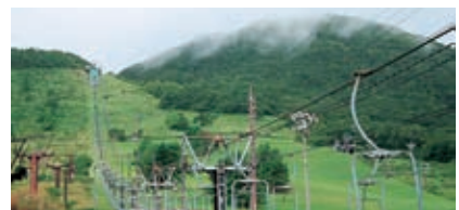
東の原から見た女三瓶山

観光リフトは4月～11月運行。リフトを使って大平山まで登ると、らとちゃんもオススメの絶景が見られる。観光リフト 8:30～16:30 定休日：毎週火曜日 ☎0854-83-2020 (三瓶観光株式会社)