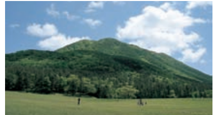
北の原から見た男三瓶山