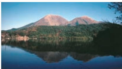
浮布池から見た三瓶山

観光リフトは4月～11月運行。リフトを使って大平山まで登ると、らとちゃんもオススメの絶景が見られる。観光リフト 8:30～16:30 定休日：毎週火曜日 ☎0854-83-2020 (三瓶観光株式会社)