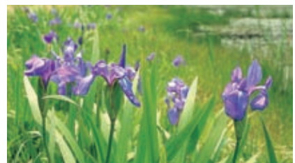
姫逃池のカキツバタ 三瓶自然館

姫逃池に群生するカキツバタ。6月上旬には見ごろを迎え、カキツバタ祭のイベントも開催される。