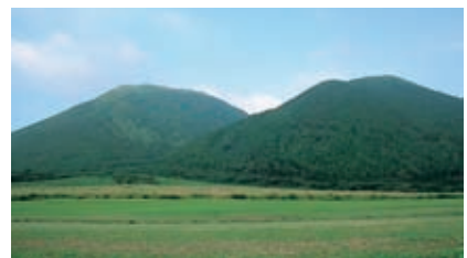
西の原から見た三瓶山