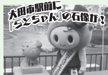
大田市駅前に『らとちゃん』の石像が! 温泉津町福光で採れる福光石を使った『らとちゃん』の石像