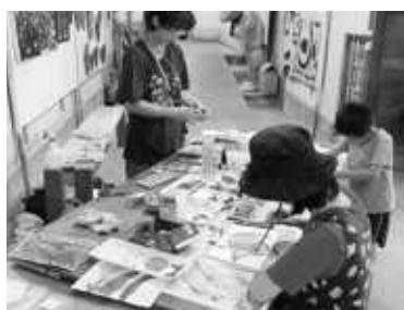
▲イベント期間中には、ワークショップなども行われました

出展作品の中から優秀アーティスト23名(うち大田市の方4名)の作品は、10月中旬からベルリンのギャラリーで展示され、「ミュージアム竹下成果工場」は、世界に向けて芸術を発信する場となっています。