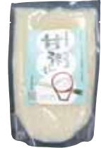
石見銀山の甘鯛さん 中木屋本店 ☎0854-85-8501