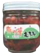
梅の華もろみ 有限会社 山陰食品センター ☎0854-82-2241 http://www.ohdacci.com/kigyou/saninsyokuhin/