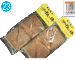
石見銀山「げたのは」 有馬光栄堂 ☎0854-89-0629