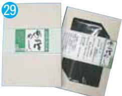
めのはめし 株式会社 渡辺水産食品 ☎0854-82-8011 http://www.watanabe-ss.jp/