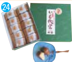
郷土史銘菓 いも代官 御菓子司 和香 ☎0854-82-7471