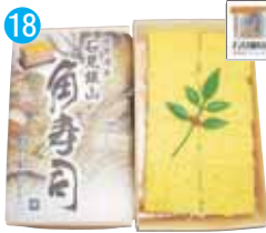
角 寿司 有限会社 デイリーフーズ誠 ☎0854-82-9198