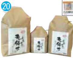
石見銀山 天領米 石見銀山農業協同組合 ☎0854-82-1001 http://akahomoti.jp/index.html