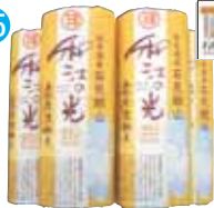
和江の光 (すまき蒲鉾) 上野屋蒲鉾店 ☎0854-84-8121 http://www.e-sutokama.com/