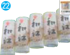
『和江』(スト蒲鉾) 松下蒲鉾店 ☎0854-84-8003