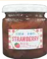
いちごジャム 莓のきむら農園 いちご屋さん ☎0854-82-1676 http://kimura-farm.com/