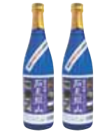
純米吟醸「石見銀山」 一宮酒造 有限会社 ☎0854-82-0057 http://ichinomiya-s.jp/