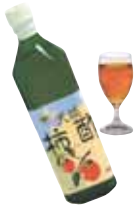
天領柿酢 柿の酢 有限会社 藤間要二郎本店 ☎0854-88-2832