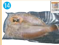
一日漁の甘鯛一夜干 有限会社 岡富商店 ☎0854-82-8102 http://www.rakuten.co.jp/okatom/