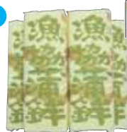
和江漁協蒲鉾 J F 島根大田支所 ☎0854-84-8011 http://www2.ocn.ne.jp/~waefu/