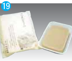
ごまどうふ 鮮魚 中田商店 ☎0854-89-0618