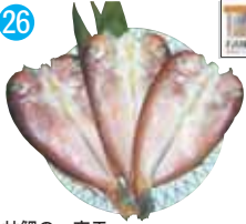
甘鯛の一夜干 榎商店 ☎0855-65-2305 http://www.kaji-shouten.shop-site.jp/