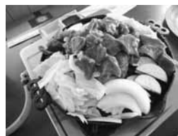
ジンギスカン（2人分）